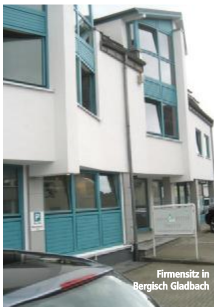
Firmensitz in Bergisch Gladbach

merische Entscheidungen getroffen und laufend die wirtschaftliche und finanzielle Situation des Unternehmens beobachtet werden. Ein weiterer Schwerpunkt bildet die vorausschauende Planung der Unternehmensnachfolge sowie ein Check-up ob die Altersvorsorge des Unternehmers gesichert ist. Dies erfordert oft eine individuelle Beratung in Fragen der Vermögensgestaltung.